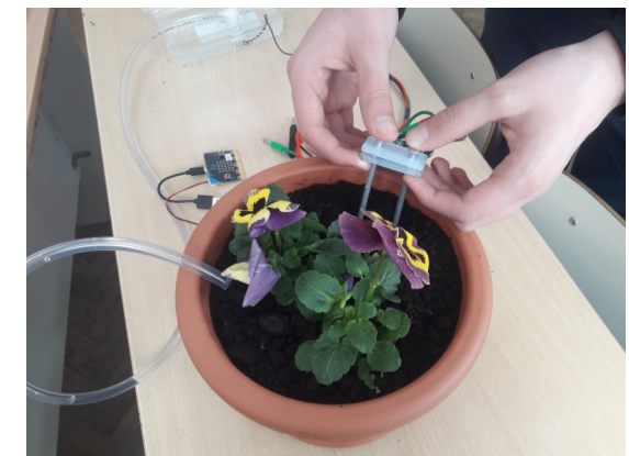
DIE FAKTOREN DES WASSERVERBRAUCHS, DER TEMPERATUR UND DES MUSIKEINFLUSSES ERFORSCHTEN WIR AUF DER PFLANZE STIEFMÜTTERCHEN